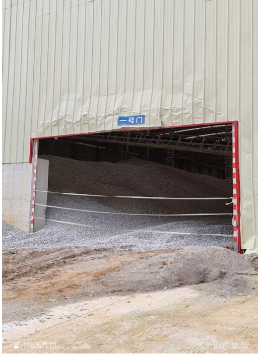
a 进入事故现场一号门