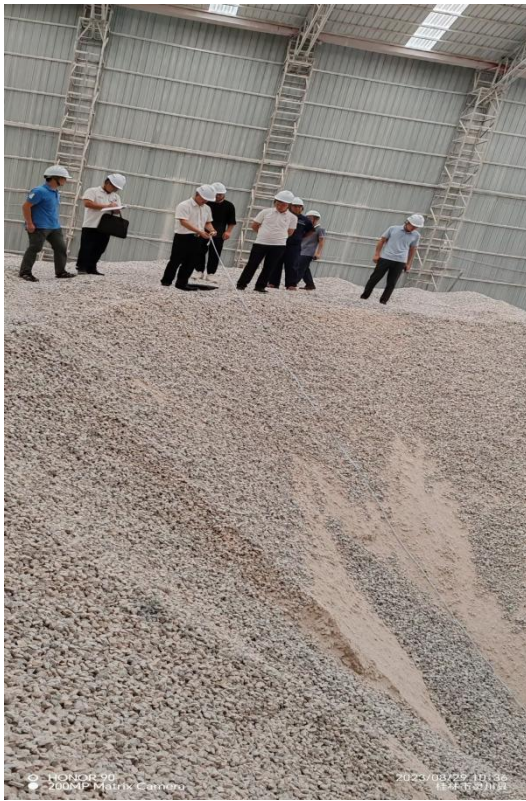
b 调查组人员站在漏斗顶部